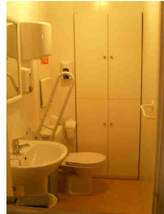
Imágenes de algunos de los servicios que ofrece el recurso