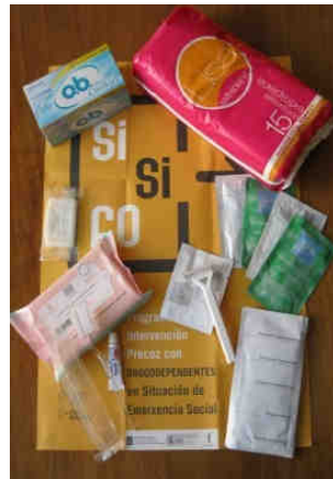
Kit de higiene