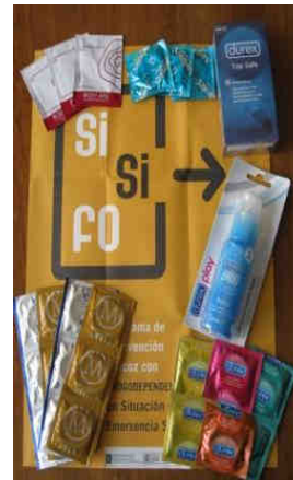
Kit de sexualidad